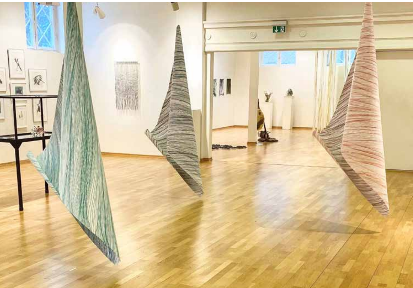
KHRONOS, 2020, TUSJ PÅ PAPIR